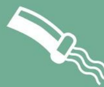
SISTEMA DE RIEGO CON AGUA DE LLUVIA