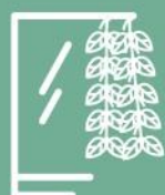
JARDINES EXTERIORES VERTICALES

Te presentamos un nuevo edificio a construirse sobre calle San Lorenzo 2546, San Martín. Con la financiación de siempre y una calidad premium, se suma un nuevo COMPROMISO , incorporar atributos de REDUCCIÓN DE CONTAMINANTES .