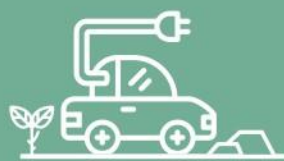
ESTACIONES DE CARGA PARA AUTOS ELÉCTRICOS