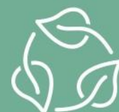
CESTOS PARA RECICLAJE DE BASURA

PENSAMOS EN UN MEJOR FUTURO PARA EL MEDIO AMBIENTE