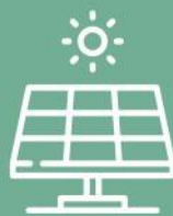
PANTALLAS SOLARES PARA ESPACIOS COMUNES